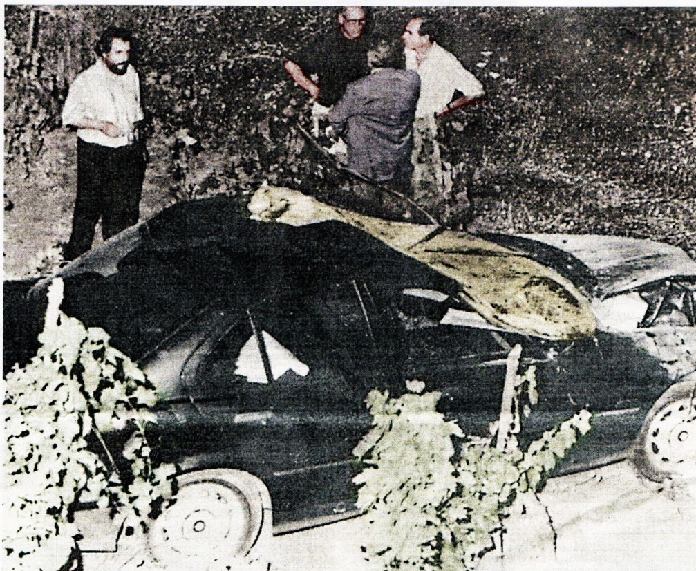
L'auto del giudice Antonino Scopelliti finita in una scarpata a Campo Calabro dopo l'agguato il 9 agosto 1991

Che cos'era questo teorema Buscetta? Secondo quanto ha raccontato il principe dei pentiti riempiendo migliaia e migliaia di pagine di verbali controfirmati da Giovanni Falcone, Cosa nostra aveva un'organizzazione piramidale, al cui vertice c'era una "Cupola" e ogni omicidio che l'organizzazione